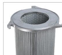
Jet3 & Jet4